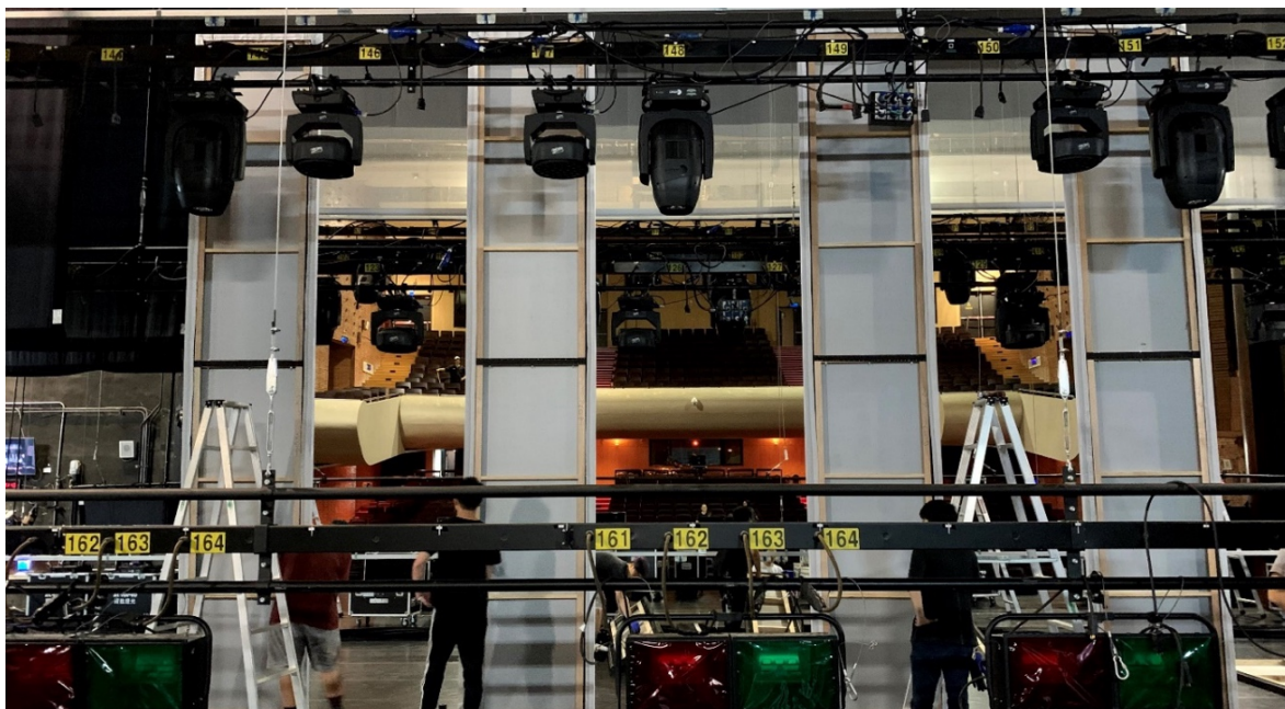
▲ 幕後導覽開箱黑衣人的一舉一動，從背面看舞台。