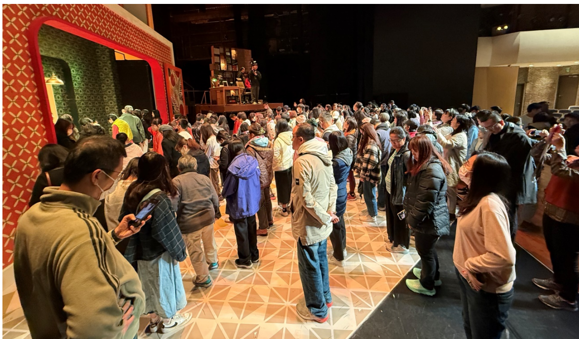
▲ 透過講解與站上舞舞台近距離看見燈光舞台，打破舞台鏡框，親近劇場。